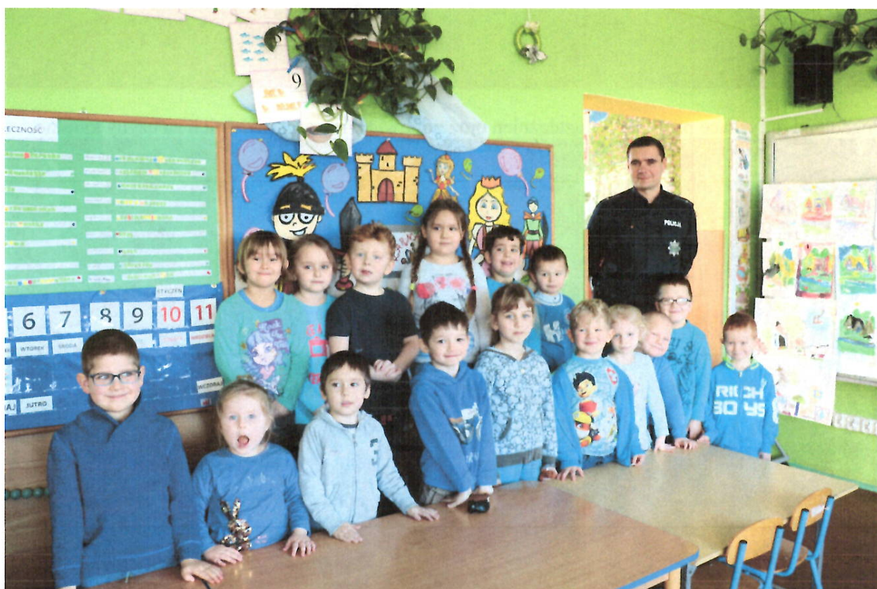
Spotkania z dziećmi klas 1 – 3, które w głównej mierze mają na celu edukację w zakresie bezpieczeństwa w ruchu drogowym.

Przy współpracy funkcjonariuszy Zespołu Profilaktyki Społecznej, Nieletnich i Patologii z Komendy Powiatowej Policji w Nakle nad Notecią realizowane są czynności prewencyjne, które w głównej mierze odbywają się w formie pogadanek z młodzieżą.