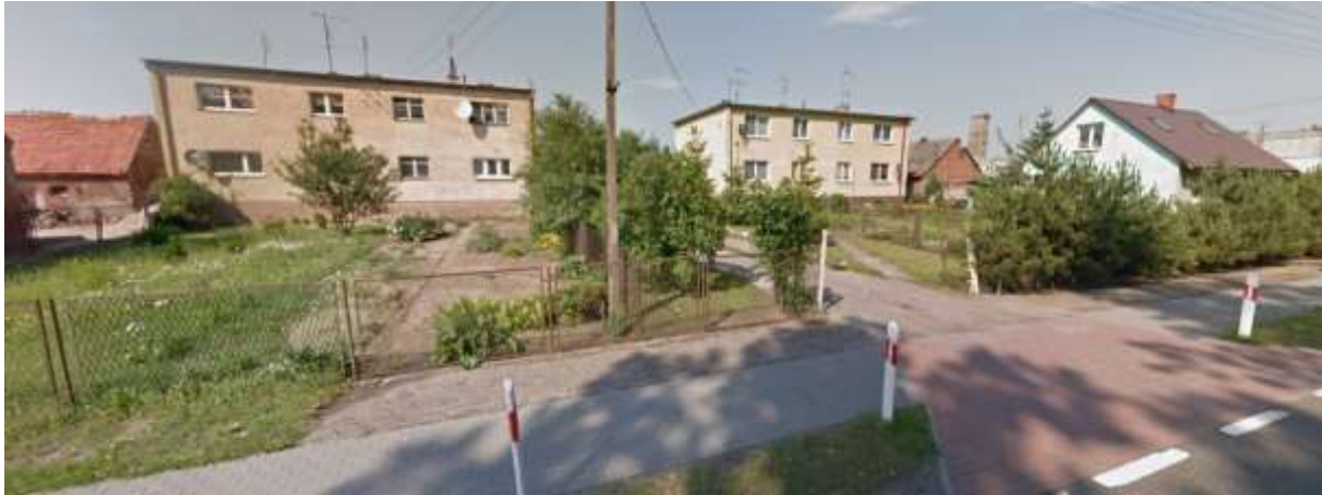
Zabudowa mieszkaniowa wzdłuż drogi krajowej

Na analizowanym terenie obowiązuje moc uchwała nr XXIV/74/2012 Rady Gminy Sadki z dnia 22 listopada 2012 r. w sprawie uchwalenia miejscowego planu zagospodarowania przestrzennego fragmentu terenu we wsi Mrozowo.