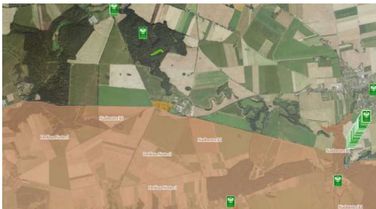
Teren opracowania na tle obszarów chronionych