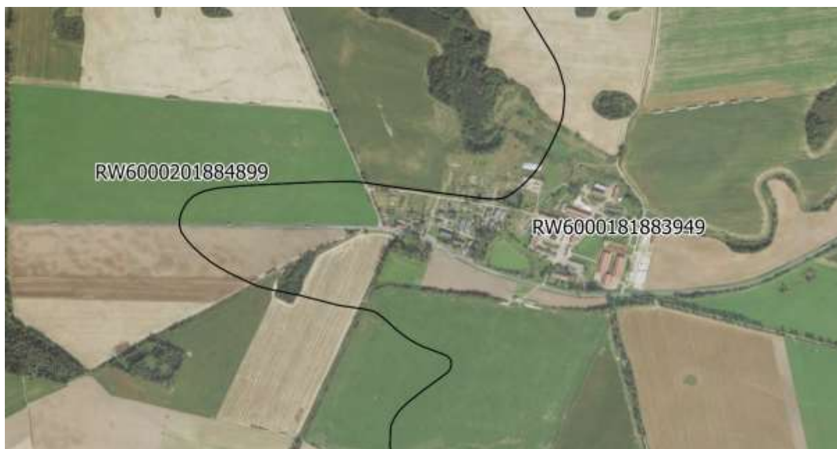
Mapa z lokalizacją JCWP

Powyższe uwarunkowania wyznaczają szerszy kontekst stanu środowiska analizowanego obszaru. W skali lokalnej – dotyczącej konkretnie analizowanego obszaru i jego bezpośredniego sąsiedztwa, najważniejszymi czynnikami kształtującymi stan środowiska, są: