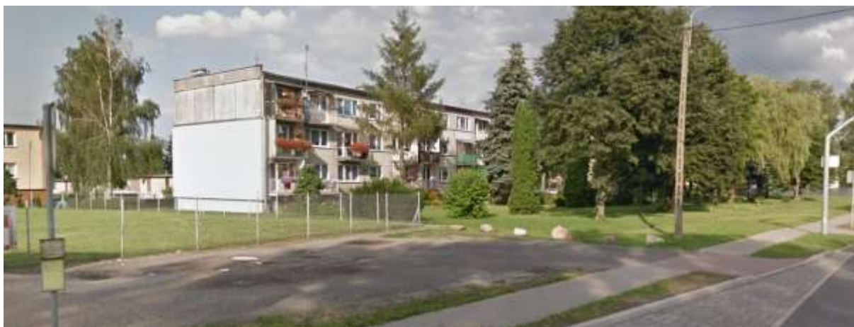
Zabudowa mieszkaniowa wielorodzinna wzdłuż drogi krajowej