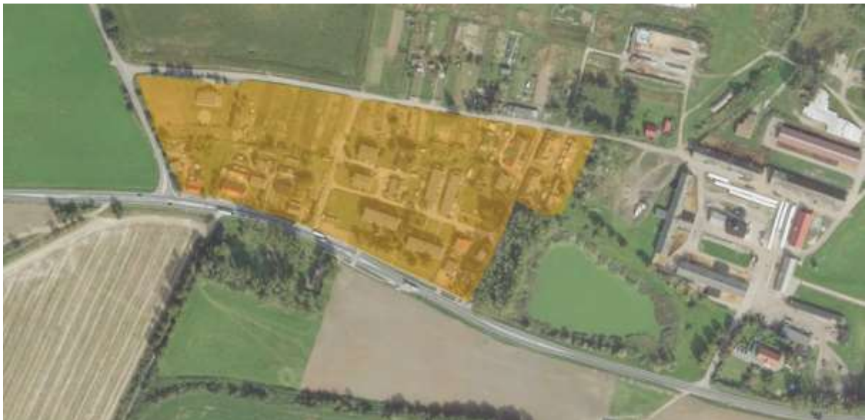
Charakter zagospodarowania analizowanego terenu

Teren opracowania obejmuje obszar o powierzchni około 5,7 ha, w większości są to tereny z zabudową mieszkaniową jednorodzinną i wielorodzinną. W północno-zachodniej części znajduje się budynek oznaczony jako dom kultury, obok którego znajduje się plac sportowy. Przy drodze krajowej znajdują się dwa obiekty handlowo-usługowe. W północno-wschodniej części znajdują się budynki gospodarcze gospodarstwa rolnego. Na analizowanym obszarze w części południowo-zachodniej oraz wschodniej występuje granica strefy „B” ochrony konserwatorskiej, na terenie znajdują się dwa obiekty ujęte w ewidencji zabytków.